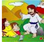
Solo tu Palabra sacia mi corazón

Reflexión: Una vez que nos hemos sentado a escuchar atentamente las palabras de Jesús y hayamos hecho conforme a su voluntad las cosas de este mundo temporal ya no nos saciarían solo Jesucristo es el que llena nuestro corazón y suple nuestra necesidad