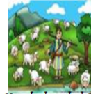
Mi vida depende de la Jesús

Reflexión: Debemos entender que al ser apacentados (cuidados y alimentados) correctamente tendremos una vida espiritual firme y enfocada a Dios producto de una vida alineada a su voluntad, mostrando una relación de dependencia al poder de Dios y la palabra de su gracia con integridad e interés