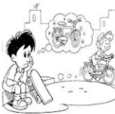
10º No tengas envidia de otros

Reflexión: El décimo mandamiento es: "NO codiciarás" La codicia es el deseo de querer tener más y más cosas que no puedo tener, pero quiero tener. Es una enfermedad que se encuentra en nuestro corazón y la medicina para sanar de esta enfermedad es el contentamiento. Que es el gozo de haber encontrado en Cristo todo lo que necesitamos para llevar a cabo su propósito en nuestras vidas.