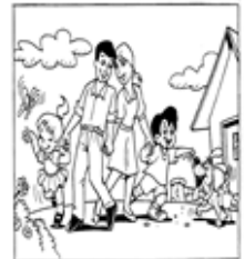
7º No practiques la Inolición

" Mas el que comete (rio-a-te-dul) _____ es falto de (to-en-en-mi-ten-di) _____; Corrompe su (ma-al) _____ el que tal hace. Heridas y (za-güen-ver) _____ hallará, y su (ta-fren-a) _____ nunca será borrada"