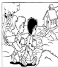
4º Guardo el día del Señor

Reflexión: En esta semana veremos que el SEÑOR dio a su pueblo un recordatorio del día de reposo que, ahora va a formar parte de los diez mandamientos, el SEÑOR establece este mandamiento como una señal de su pacto con su pueblo.